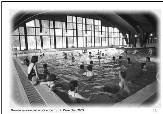
Gemeindeversammlung Oberiberg - 14. Dezember 2005